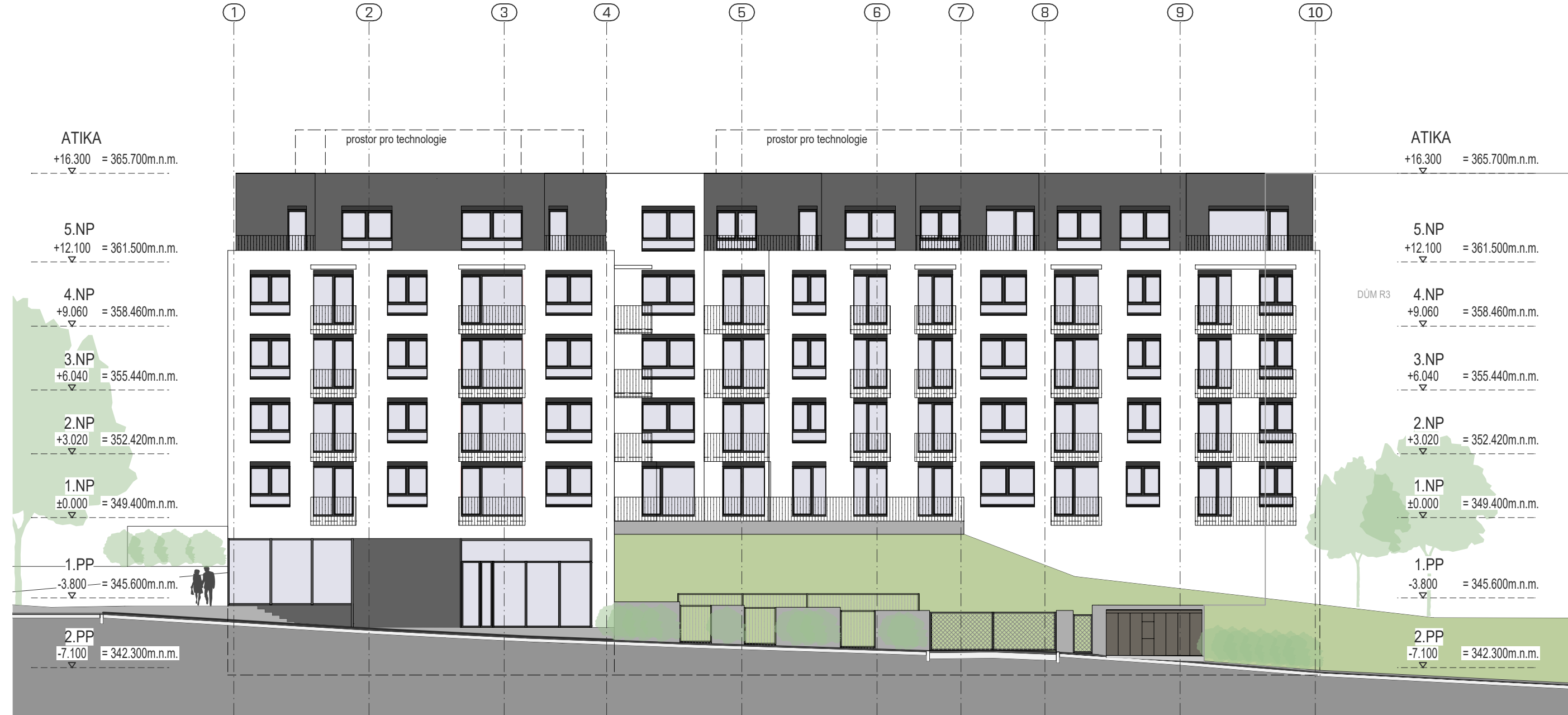
POHLED OD JIHOZÁPADU